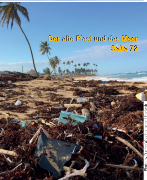
Der alte Plast und das Meer Seite 72