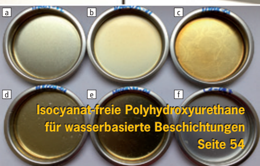
Isocyanat-freie Polyhydroxyurethane für wasserbasierte Beschichtungen Seite 54