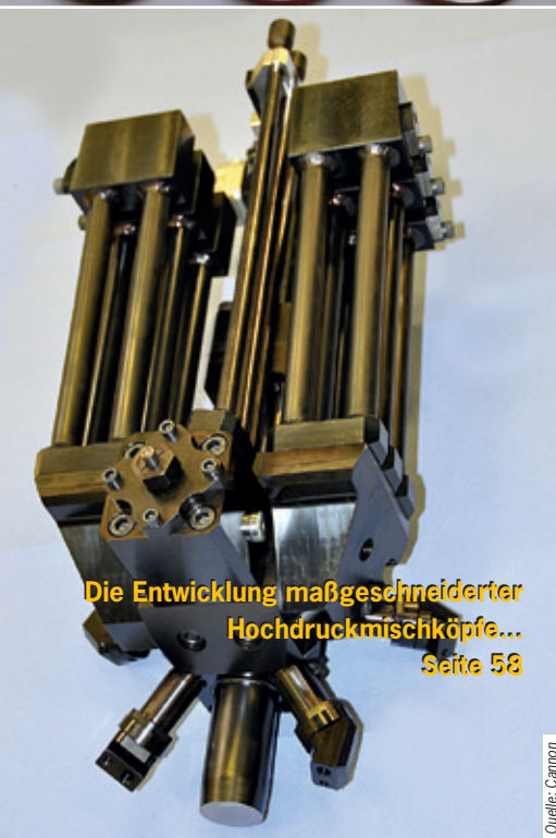
Die Entwicklung maßgeschneiderter Hochdruckmischköpfe... Seite 58