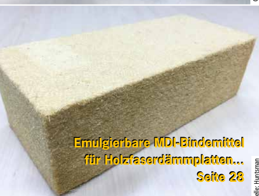
Emulgierbare MDI-Bindemittel für Holzfaserdämmplatten... Seite 28