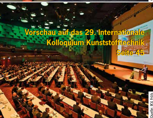
Vorschau auf das 29. Internationale Kolloquium Kunststofftechnik Seite 45