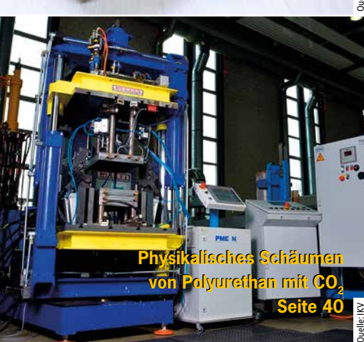
Physikalisches Schäumen von Polyurethan mit CO 2 Seite 40