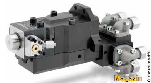
Magazin Seite 6